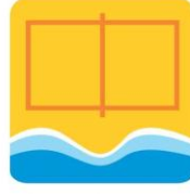
Vôlei de Praia