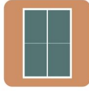
Tênis de Mesa