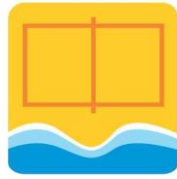
Vôlei de Praia